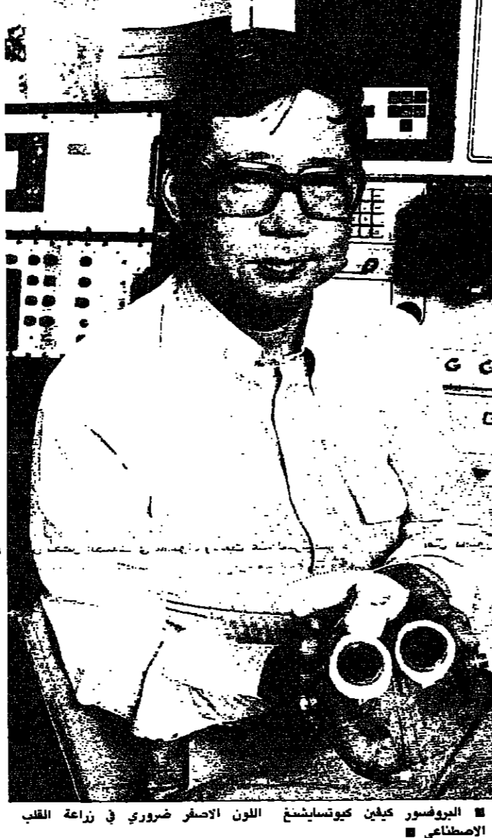
البروفسور كيفان كيوتسليشتنج اللون الاصفر ضروري في زراعة القلب الاصطناعي